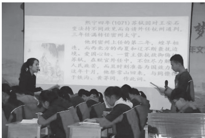
▲文学课堂展示与研讨