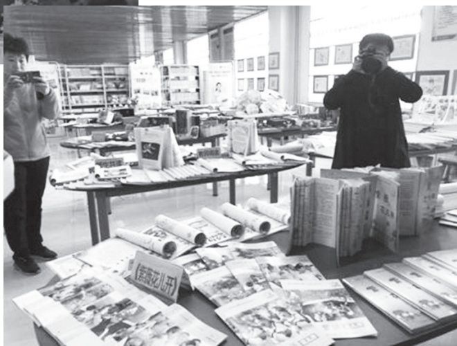
▲各校文学社团与教学成果展示